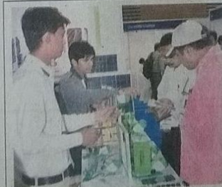
लोगों ने सौर ऊर्जा से चलने वाले उत्पादों में दिलचस्पी दिखाई।